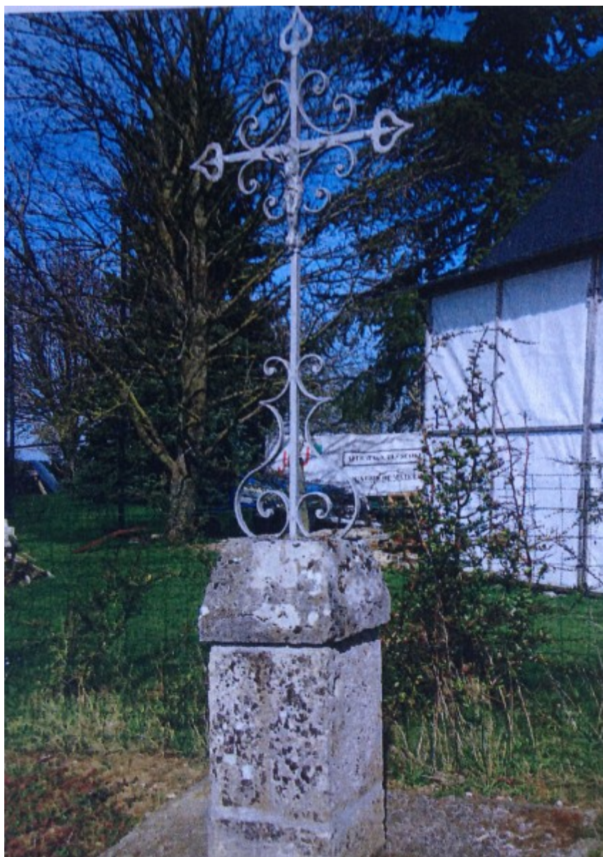
La Croix vers 2008

2 Le nouveau cimetière a été inauguré le 19 avril 1897