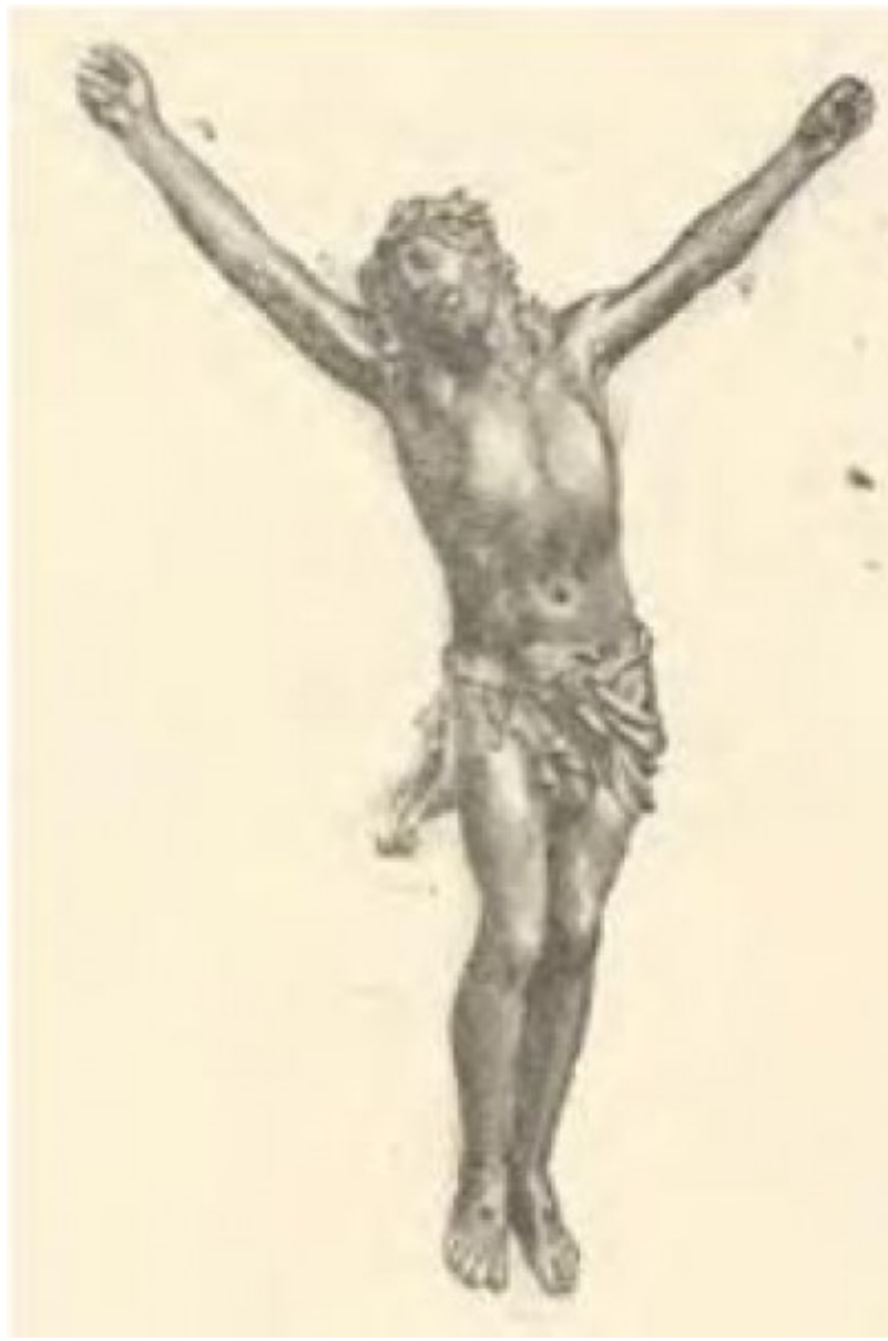
Christ d'après E.Bouchardon