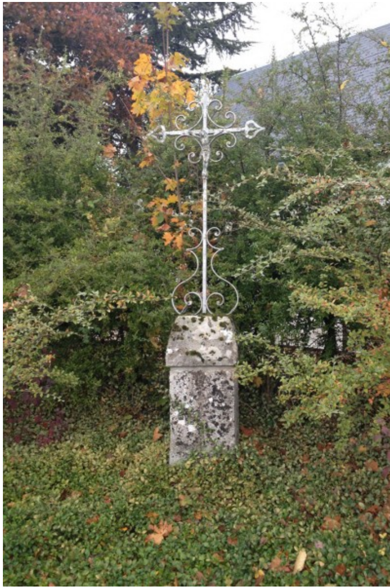
La croix en 2018