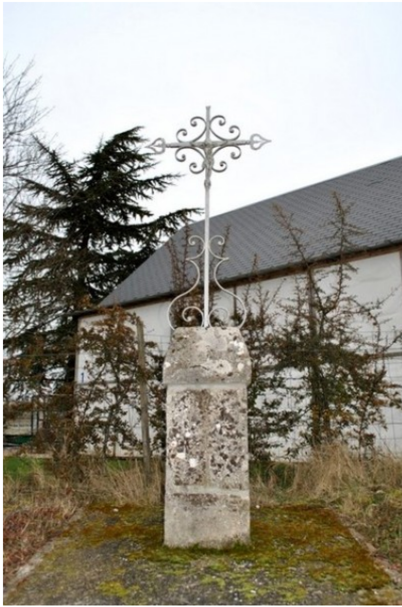
La croix de Villorceau vers 2015