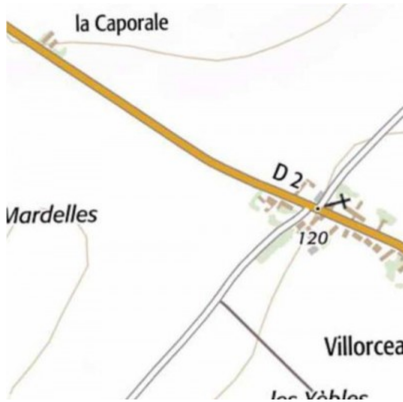
Carte IGN 2018