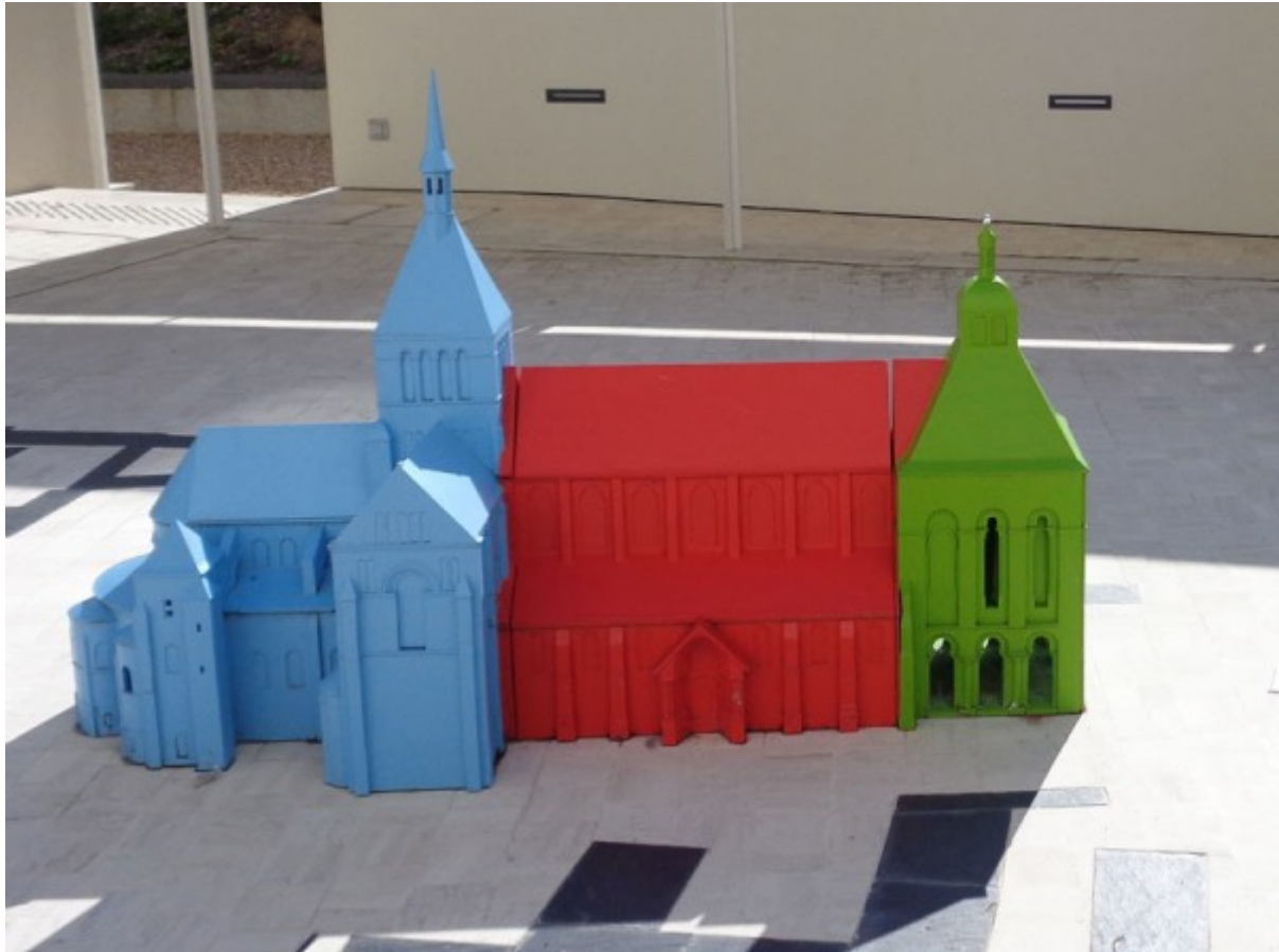
La maquette de l'abbaye de Saint Benoit à l'échelle 1/100ème dans le patio du Belvédère