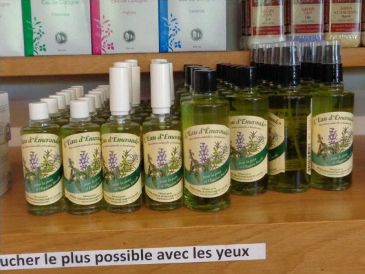
Le monastère doit