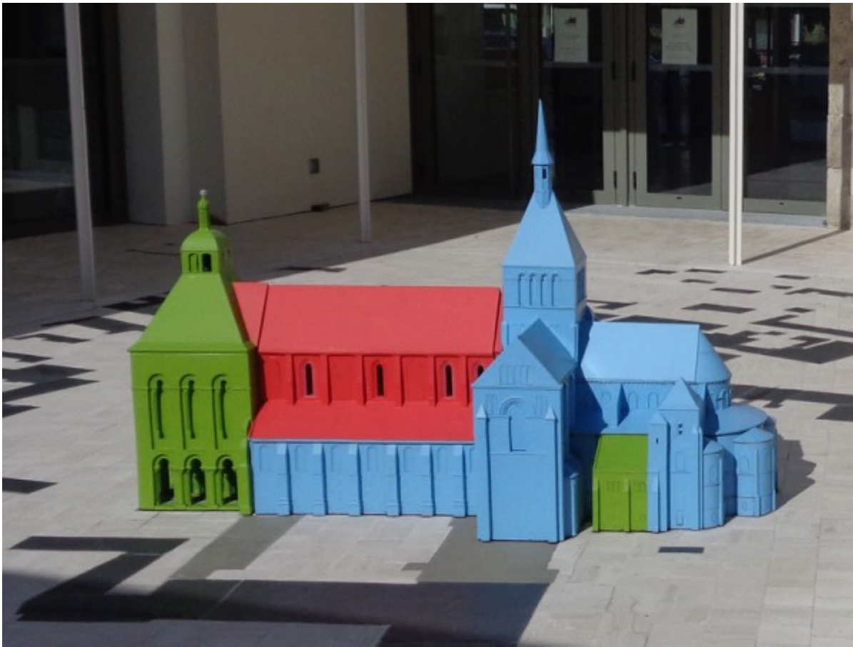
construction est représentée par une couleur différente. Le rouge la partie la plus ancienne le vert la partie intermédiaire et le bleu la partie la plus récente

Au terme de cette journée, les participants ont été invités à visiter la très belle réalisation du Belvédère à Saint Benoît sur Loire, inaugurée en 2019 par la Communauté de communes du Val de Sully. Ce projet a regroupé toutes les connaissances sur l'abbaye, son histoire sa construction, mais également sur la vie des moines. Une très belle démonstration pédagogique.