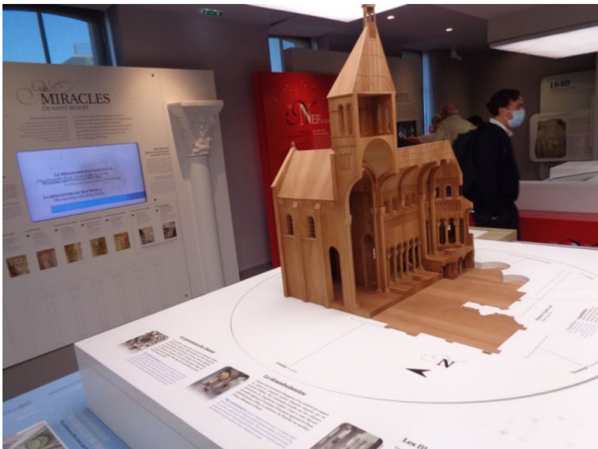
La visite du Belvédère offre aux visiteurs toute une connaissance autour de l'abbaye, son histoire, sa construction et

Au terme de cette journée, les participants ont été invités à visiter la très belle réalisation du Belvédère à Saint Benoît sur Loire, inaugurée en 2019 par la Communauté de communes du Val de Sully. Ce projet a regroupé toutes les connaissances sur l'abbaye, son histoire sa construction, mais également sur la vie des moines. Une très belle démonstration pédagogique.