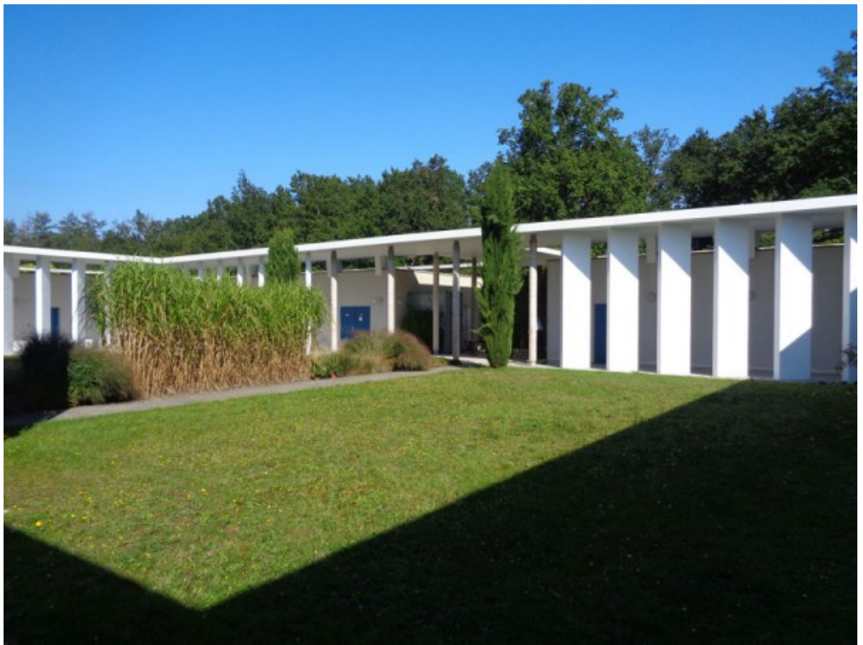
L'entrée et le cloître très moderne du monastère Notre Dame de Bouzy la Forêt.