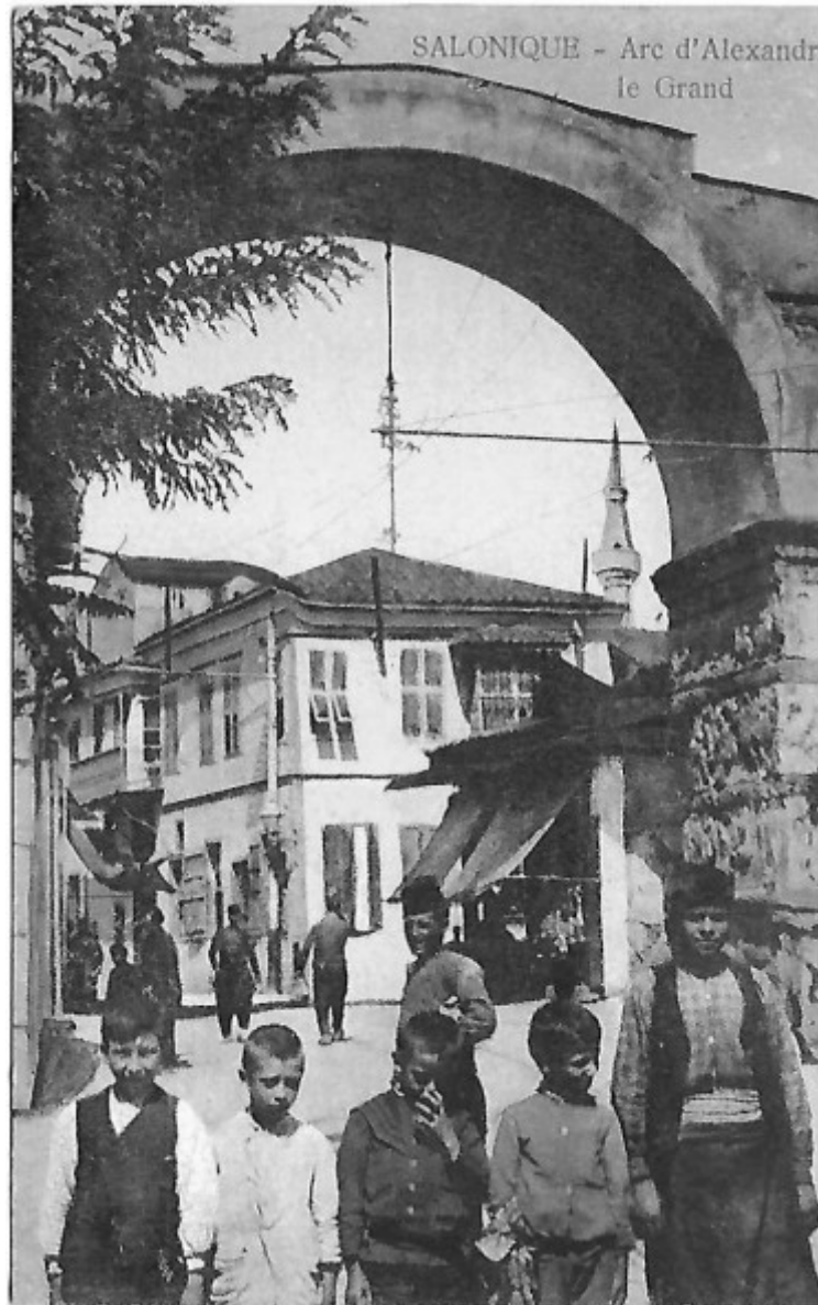
Carte postale adressée de Salonique par Marius à Jeanne