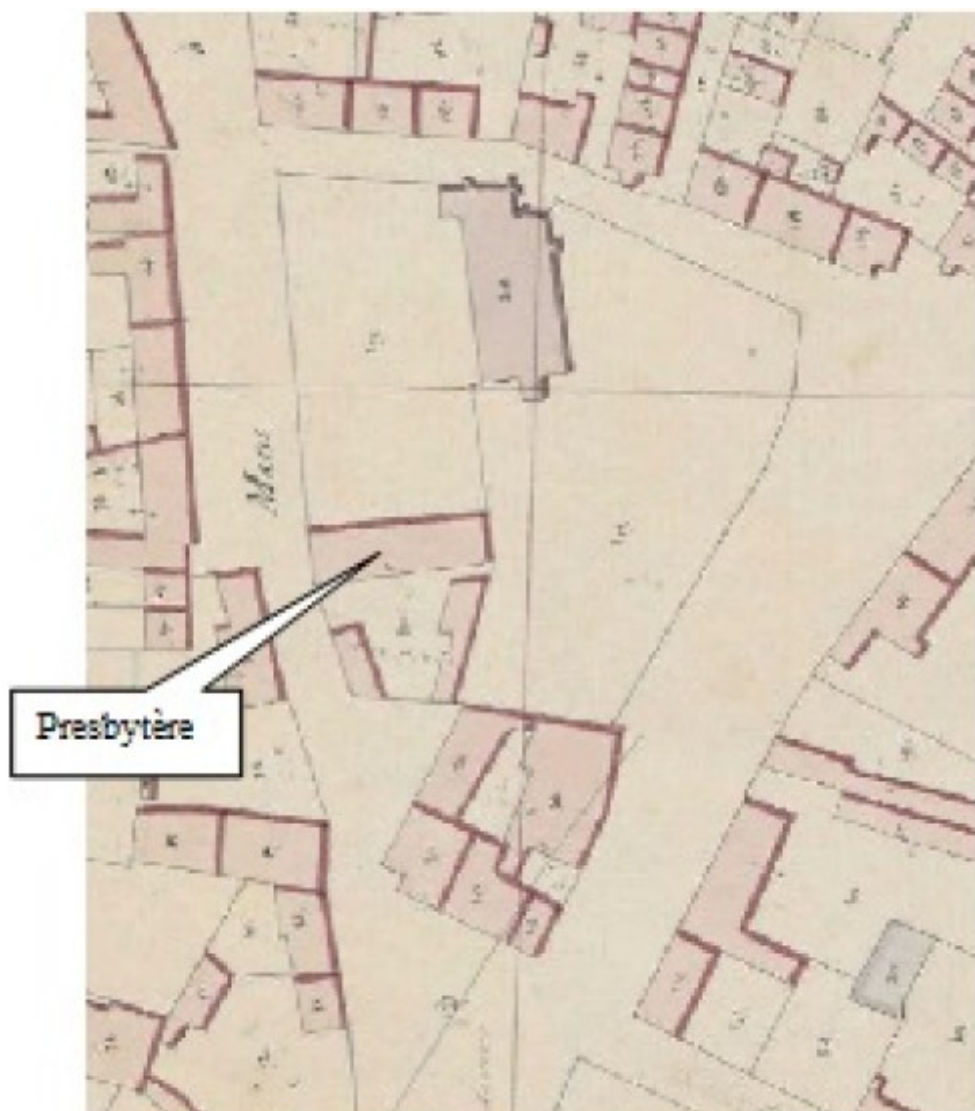
Plan de 1829 avant l'élargissement de la route principale

Extrémité de la place — Puits existant déjà en 1670— croix posée en 1860 La route d'Orléans côté presbytère n'est pas encore élargie