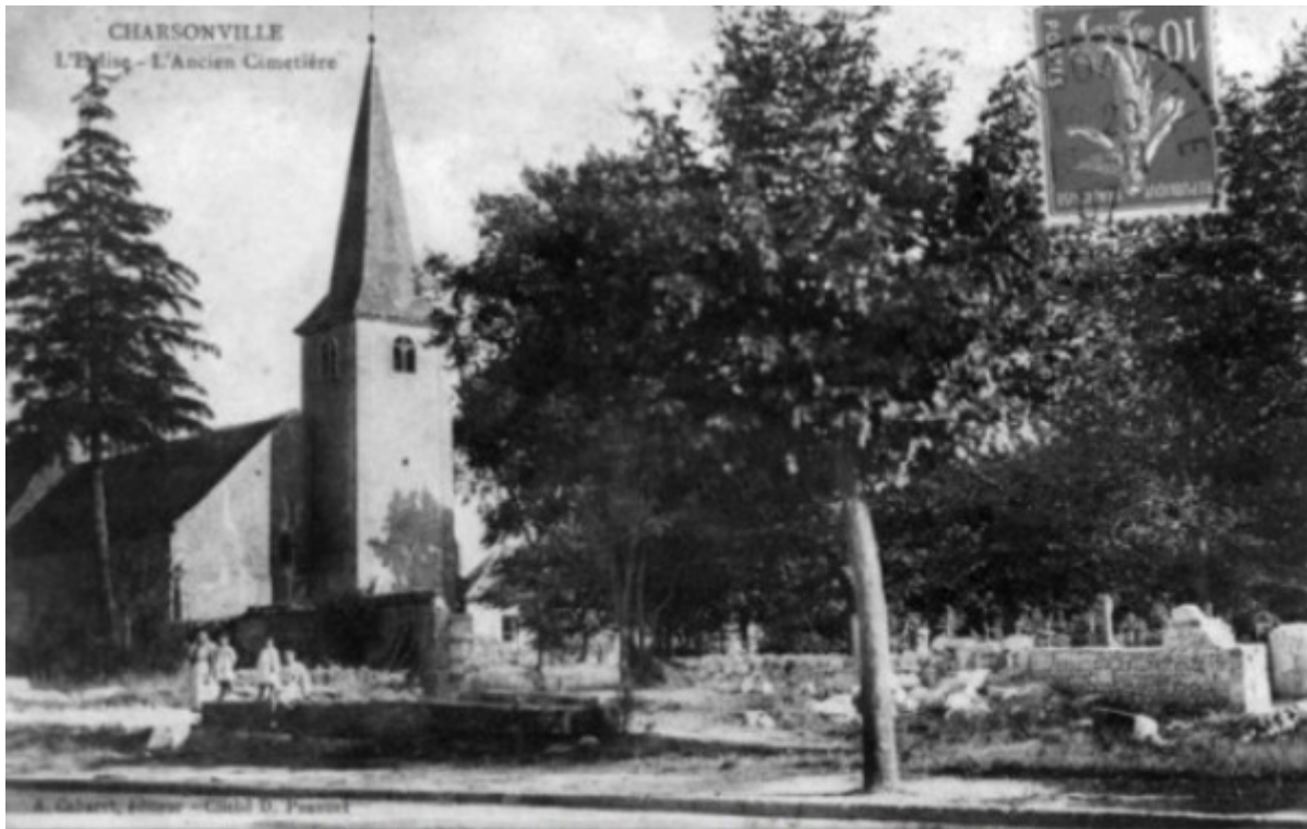
L'élargissement de la route côté place a été réalisé Le presbytère est démoli et son jardin a disparu On aperçoit encore des croix dans l'ancien cimetière