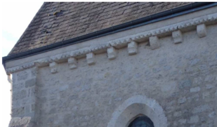
Exemple ci-dessus de corbeaux en haut des murs du chœur de l'église St Martin de Charsonville

La pose des corniches, portées sur des modillons, a persisté encore en Champagne et en Bourgogne, et on en retrouve dans ces provinces jusqu'à la fin du 13 ème siècle.