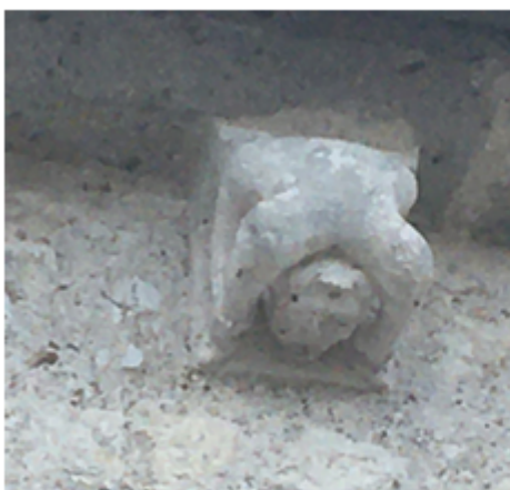
L'acrobate de Meung

C'est pour cette raison que la représentation du modillon « l'acrobate », à Meung-sur-Loire, est presque identique dans beaucoup de régions de France du côté Atlantique (Aquitaine, Poitou, Charente, Deux Sèvres, Ile de France, Normandie...).