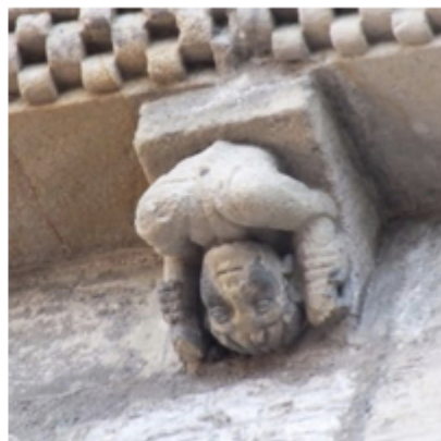
L'acrobate du Poitou

Il est difficile, étant donné l'état de la pierre, de bien distinguer la face de l'acrobate de Meung. Il semble que