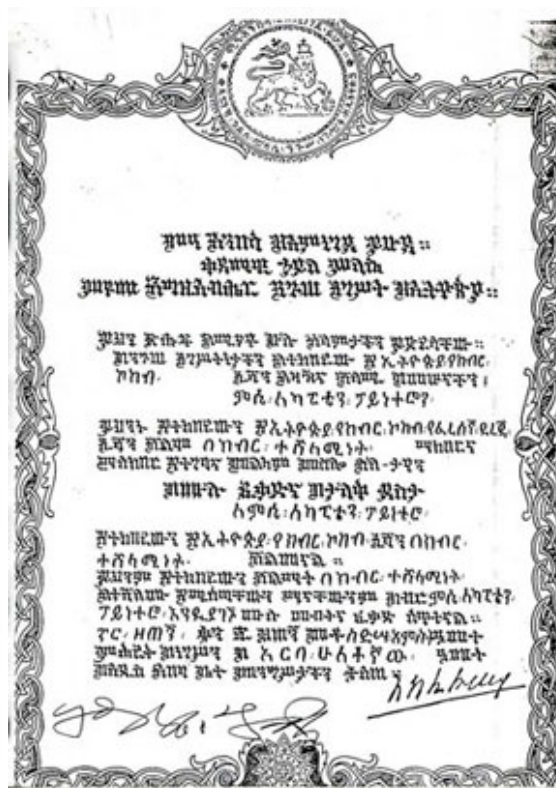
Décoration Éthiopienne (Original et Traduction)