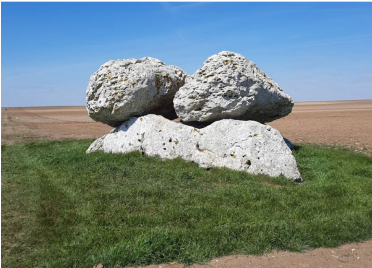
La Pierre Fenat aujourd'hui (2022)

Et la Tante Blanche a terminé en disant : « Vous voyez mé enfants c' que c' é d'avouèr envie d' la richesse qu'on a pas gagné », et nous, on é rasté tout réveu ; j' peux vous dire qu' à la messe de minuit on y a pensé au trésor de Pierre Fenat !