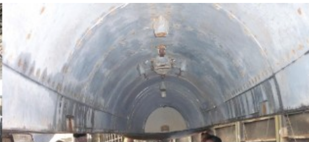
Le Mirage IV doté d'une