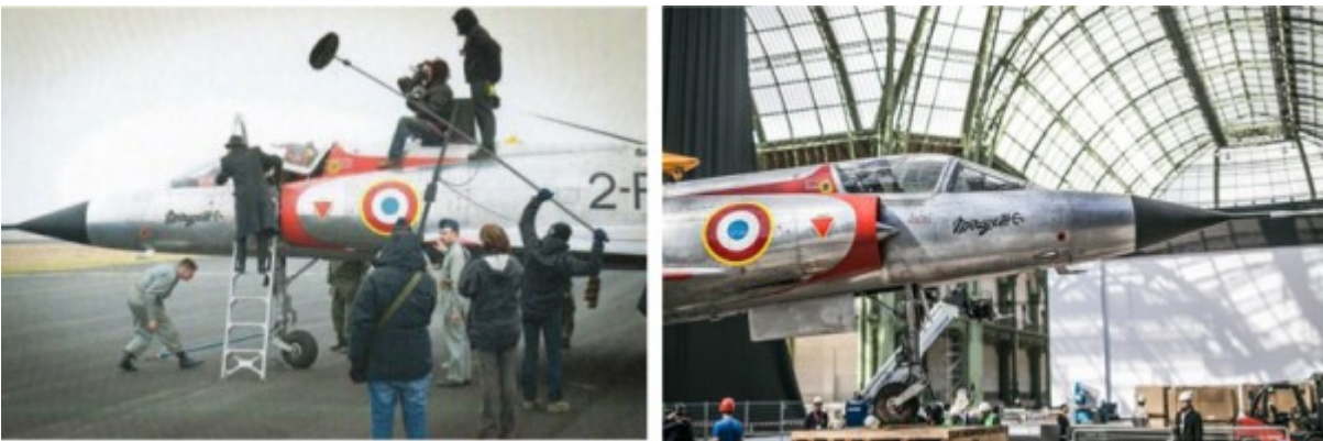
Tournage du film sur Marcel Dassault 'L'homme au pardessus' et le même Mirage IIIIC au Grand Palais à Paris

Événement organisé par le Musée de l'Armée de l'Air et de l'Espace, le 15 septembre 2012, à Paris, au Grand Palais.