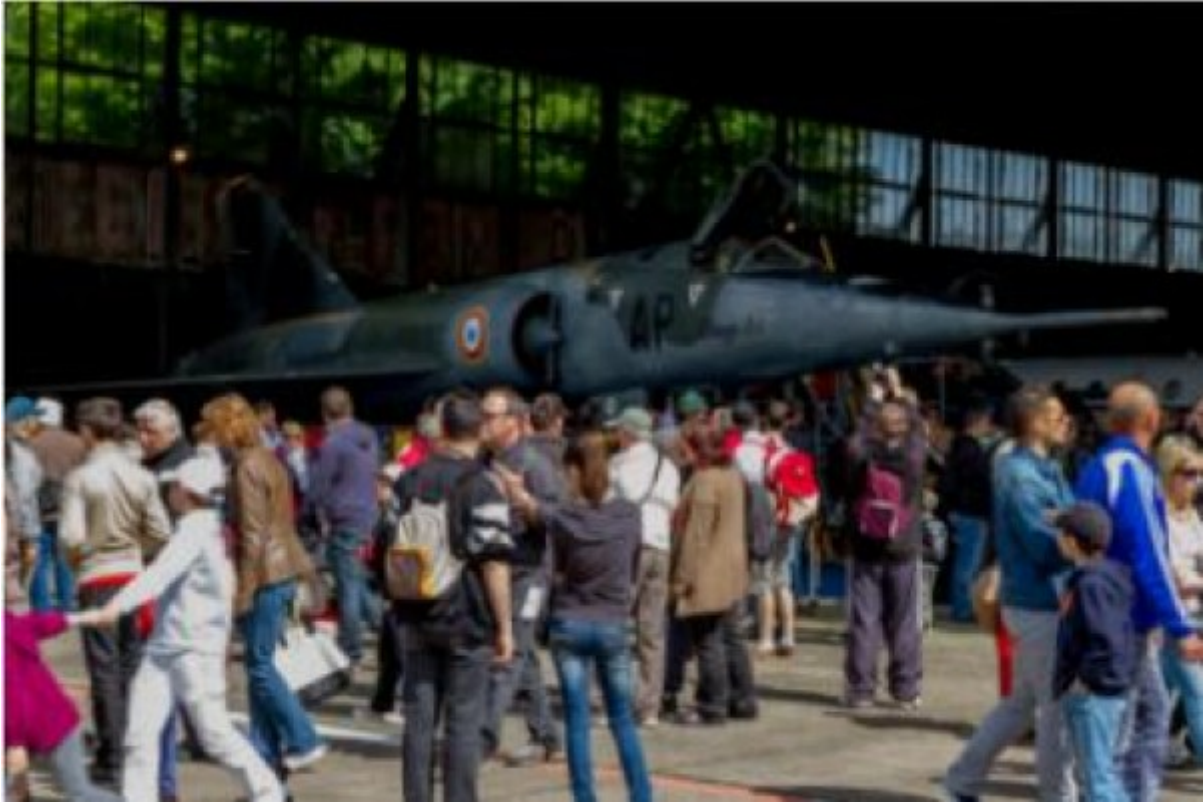
Public laux Journées européennes du Patrimoine

Événement organisé par le Musée de l'Armée de l'Air et de l'Espace, le 15 septembre 2012, à Paris, au Grand Palais.